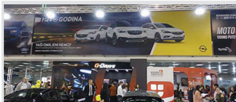
reklamna površina na vinilu, po m 2 m 2 3.000 din/m 2