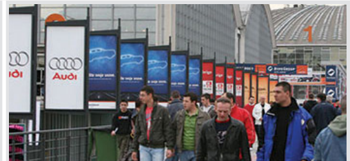
bilbord obostrani na pasareli 95x195 cm, papir kom. 9.900 din/kom.