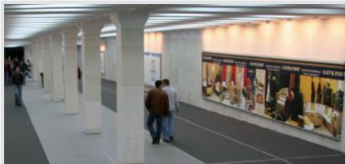
megabord, podzemni prolaz 995x195 cm, papir, osvetljen kom. 48.750 din/kom.