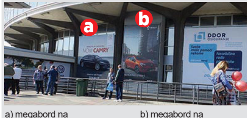
a) megabord na hali 1, 6x6, vinil kom. 150.000 din/kom.