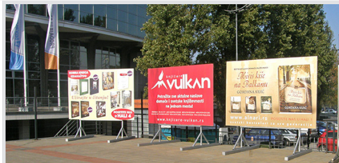
bilbord 300x200 cm, papir kom. 22.500 din/kom.