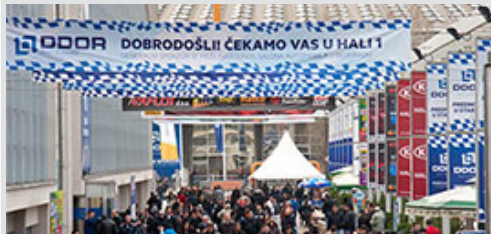
kolonada ispred hale 2, vinil 8x1 m sa 4 bilborda 95x195 cm kom. 55.000 din/kom.