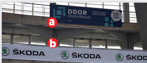
a) pano 6x1.5m kom. 16.000 din/kom.